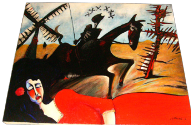
O quadro D. Quixote, de Catinari, sobre o famoso personagem de Cervantes, revela o desejo do ser humano de substituir a realidade pelo mundo das próprias idéias delirantes

Do mesmo modo, quando uma obra de arte nos mostra e nos faz sentir o belo