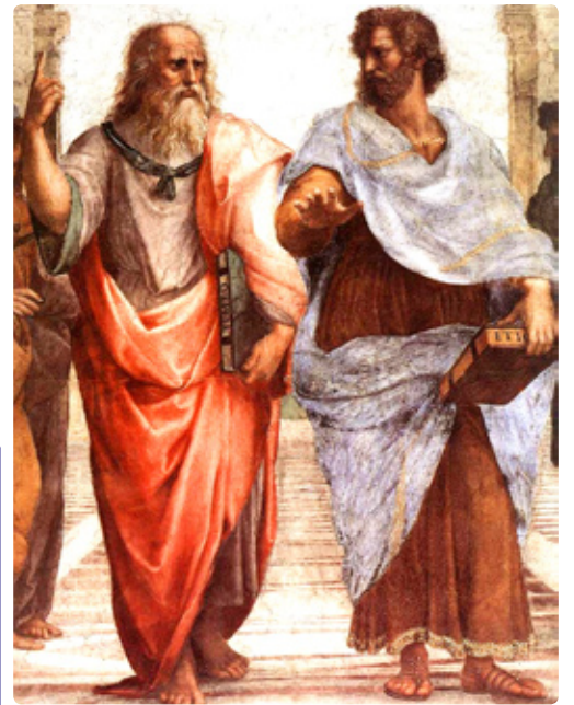
Raphael, "Escola de Atenas" (1509-1510) - Vaticano, Roma

Este é o grande valor da ciência trilogica, que conseguiu deslindar o motivo por que um sistema filosófico (ou teológico), por mais perfeito que seja, não atinge os resultados esperados. Antes do conhecimento e de toda realização, existe a psicopatologia que, enquanto não for cuidada satisfatoriamente, o ser humano não atingirá paz e pleno desenvolvimento.