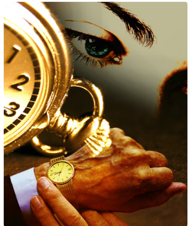
A ansiedade é oriunda do conflito entre a existência temporal e a eterna

Ao ler este livro, muitos se perguntarão: - Se nascemos dentro do tempo e do espaço, não temos outra saída, senão sermos limitados e doentes. Isto é um fato, no entanto temos possibilidades ainda de anular o tanto quanto possível esses elementos redutores, para ampliar nossa percepção e a própria vida.