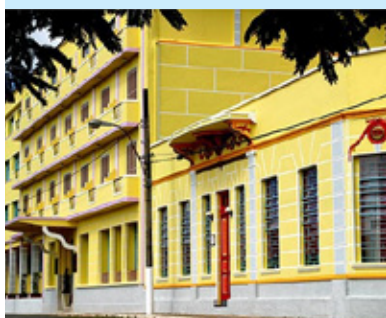
GHT e Teatro Thalia, anexo ao hotel

Vivência em artes, transcendência e qualidade de vida no feriado prolongado de 22 a 25 de maio, no Grande Hotel Trilogia (GHT) em Cambuquira, MG.