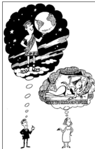
Teomania: desejo de ser um Deus

Nas mulheres, a teomania já se manifesta sob a forma de narcisismo — ou seja: adorar-se pelos seus atributos pessoais. A mulher acha que só pelo fato de ser quem é, já está encantando a humanidade (mesmo que não perceba, é assim que pensa, no fundo). Por isso, exigem ser sempre admiradas, amadas, valorizadas, não pelo que realizam, mas pelo que são, e muitas vezes, só pelo seu corpo, como se fossem verdadeiras musas de beleza ou de grande sensualidade.