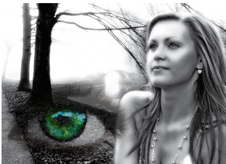
O sono é o protetor do sonho e não o contrário

Por Norberto Keppe, psicanalista, filósofo, pedagogo e cientista social. Extrato do livro Metafísica Trilógica, vol 2 – Fenômenos Sensoriais Transcendentais .