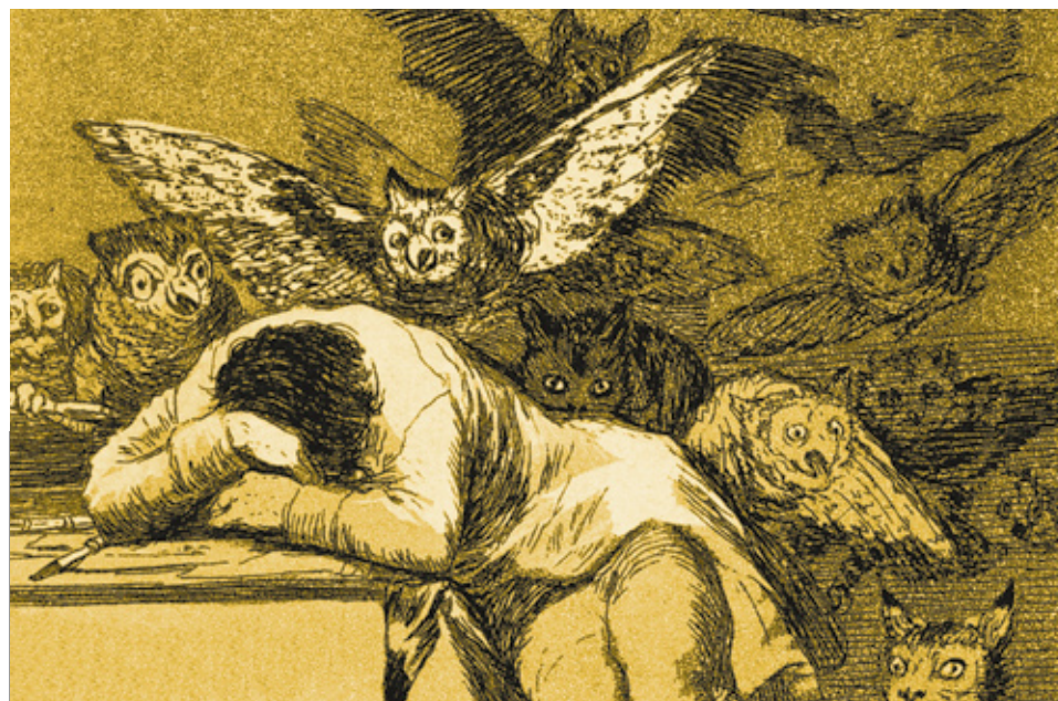
A consciência funciona perfeitamente no sonho. (Esta pintura de Goya foi usada para a capa do livro O Universo dos Espíritos , de Norberto Keppe.)

O neurofisiologista francês, Michel Jouvet, estudou os sonhos através do eletroencefalograma, notando que existem três fases: 1) estado de vigília, 2) um segundo de sono, 3) e finalmente o de sonho, quando o corpo não demonstra qualquer atividade muscular, fechando totalmente suas portas ao mundo exterior — mostrando que o sono é o guardião do sonho, e não o contrário como pensava Freud.