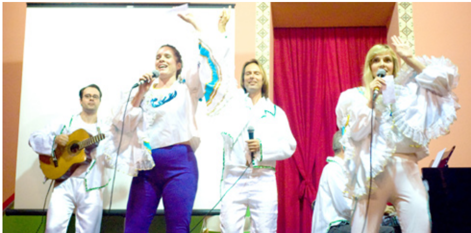
Apresentação do Teacher Band da Millennium segue a idéia de que a arte é fundamental no ensino

Estes princípios da metafísica são fundamentais para o entendimento de todos os campos do conhecimento e se mostram muito práticos e eficientes no ensino que praticamos no dia-a-dia na Escola Millennium.