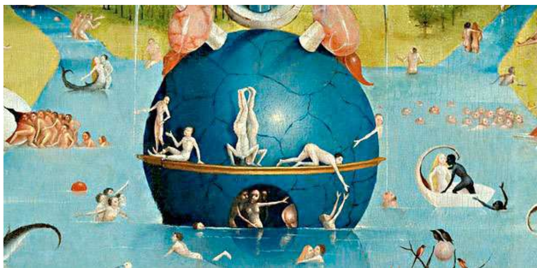
"O Jardim das Delícias", Jerónimo Bosh (El Bosco)

Numa sessão de psicoterapia de grupo existe uma moça que fala francamente sobre seus amantes passados e presentes. Existe um senhor, muito rígido, homem de negócios, que se irrita profundamente. No pagamento que ambos fazem ao analista, a primeira