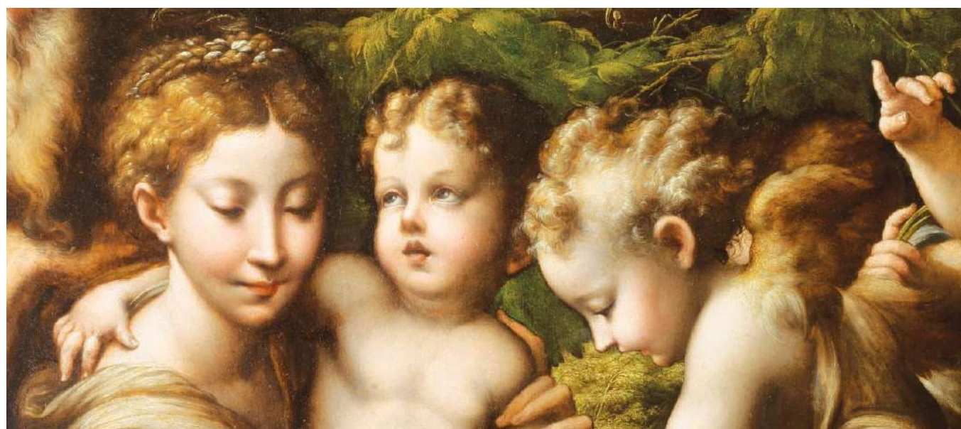
"A Sagrada Família com Anjos", Parmigianino

Este produto é impresso na PLURAL – uma empresa comprometida com o meio ambiente e com a sociedade, oferece produtos com o selo FSC® garantia de manejo florestal responsável.