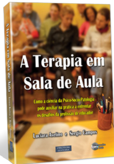
Terapia em Sala de Aula, a obra recente de Luciara Avelino

Começamos o trabalho e pouco a pouco percebi que ele tinha uma enorme dificuldade em aprender porque pensava que não era capaz e era muito perfeccionista. Comecei a notar que ele sempre dava desculpas do trânsito, do tempo etc., para suas próprias dificuldades. Tratei este tema nas aulas e ele percebeu rapidamente que tinha uma grande oposição ao conhecimento por causa do seu narcisismo e não devido a fatores secundários, como horário de estudo etc.. Ele ficou surpreso em perceber que não era só no curso de francês que fazia isso, mas em tudo na vida. Ele sempre colocava fora dele mesmo