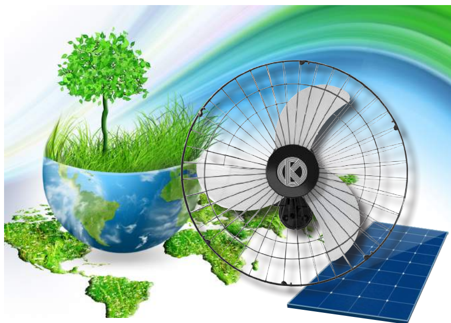
A tecnologia incorporada no Ventilador Keppe Motor UNIVERSE ECO (foto), campeão de eficiência energética, fará parte do matriz curricular do curso.

Para transmitir o que isso significa, a FATRI realizará um ciclo de palestras gratuitas sobre seus cursos de graduação, que terá início com o 1º Open Lab, dias 19 e 20 de outubro, em sua sede, em Cambuquira, MG. Serão palestras e atividades práticas sobre a tecnologia Keppe Motor e a Nova Física de Keppe/Tesla, pela 1ª vez