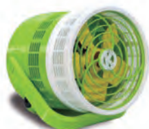
Modelo Keppe Motor Júnior (grade 12cm)