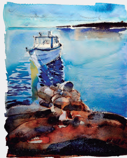
Barco de pescador - Aquarela Markku Lyyra - 2018