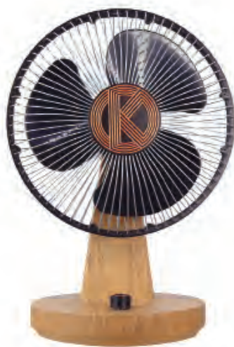
Modelo Art Déco (grade 30cm)

Os ventiladores Keppe Motor têm características únicas, com tecnologia premiada internacionalmente pela sua inovação e benefícios ao planeta, ao captar e transmitir a energia do magnetismo. São fruto das descobertas do cientista Norberto Keppe.