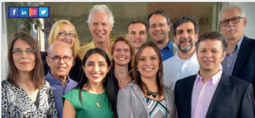
PROFESSORES INTERNACIONAIS PSICANALISTAS OU PSICO-SÓCIO-TERAPEUTAS

ALTO DA BOA VISTA R. São Benedito, 1661 (11) 5181-5527 (11) 99759-4657