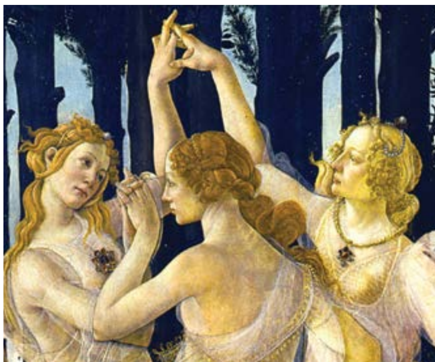
Alegoria da Primavera - Sandro Botticelli.

Estou mostrando que somos irmãos, pelo Criador, nosso Pai, não havendo necessidade de pertencer a alguma raça ou país, para sermos amados, incrivelmente, por Deus. Estamos todos no mesmo caminho maravilhoso para a Eternidade, e participando dos Bens, que nos foram dados dentro da vida: é só aceitar e trabalhar por eles, seja no campo mineral, vegetal, animal e angelical, dos anjos.